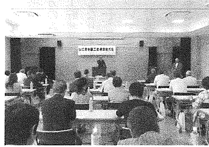
【第6回 通常総代会開催】

第62号 山口県中央商工会事務局 本所・阿知須支所 0836-65-2129 秋穂支所 083-984-2738 阿東支所 083-956-0032